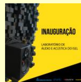
Inauguração do Laboratório de Áudio e Acústica no ISEL, em 6 de março de 2020.