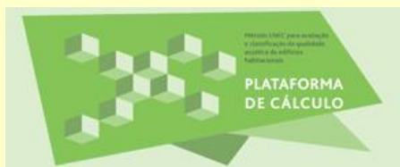
Plataforma de Cálculo - Classificação Acústica de Edifícios Habitacionais.

O LNEC desenvolveu uma plataforma de cálculo que integra uma metodologia de avaliação e classificação acústica de edifícios habitacionais, tendo em conta as exigências legais aplicáveis no domínio da Acústica da Edificação, destinada tanto aos edifícios novos como àqueles que sejam objeto de ações de reabilitação. Esta classificação assenta numa definição de classes de qualidade acústica para as várias frações habitacionais dos edifícios, integrando não só o contexto do próprio edifício, mas também a sua integração ambiental, segundo um princípio de correlação com as exigências regulamentares aplicáveis em Portugal.